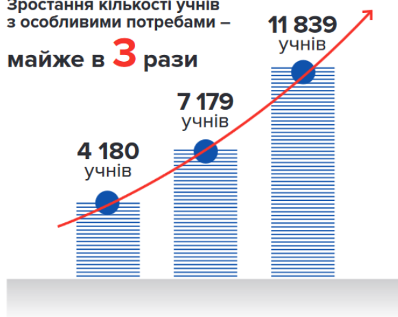
Рис.1. Динаміка показників інклюзивного розвитку України

Інклюзія в освіті – це процес, здійснення якого передбачає, насамперед, зміну філософії освіти, і як наслідок цього – організаційні, змістовні і технічні зміни. Інклюзія – інноваційний шлях розвитку освіти на всіх рівнях. Дана інновація стосується і структур управління, сфера діяльності яких поширюється на роботу з педагогами та іншими працівниками, які навчаються, батьками, здійснення зв'язку з навколишнім середовищем, контролем, аналізом, регулюванням та інформаційним забезпеченням інноваційної діяльності.