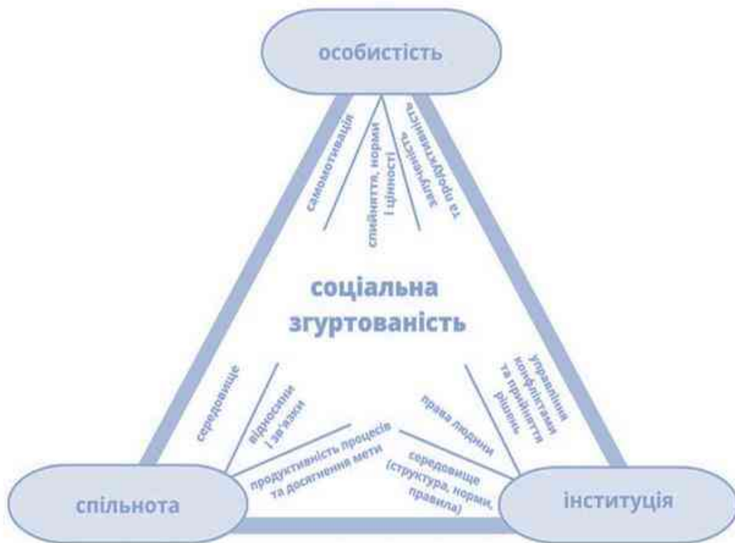
Мал. 1. Структура соціальної згуртованості

Технологія соціально-педагогічного супроводу формування соціальної згуртованості в університетському середовищі спрямована на створення умов для розвитку відкритої, підтримуючої та ціннісно об'єднаної студентської спільноти. Її реалізація покликана сприяти становленню взаємної довіри, солідарності, активної громадянської позиції та почуття належності до університетської громади. Основний акцент робиться на залученні студентів до спільної діяльності, соціальних ініціатив, волонтерства й міжособистісної взаємодії, що дозволяє не лише зміцнювати горизонтальні зв'язки, а й формувати культуру співпраці, відповідальності та взаємоповаги як основу соціальної стійкості академічного середовища в умовах сучасних викликів.