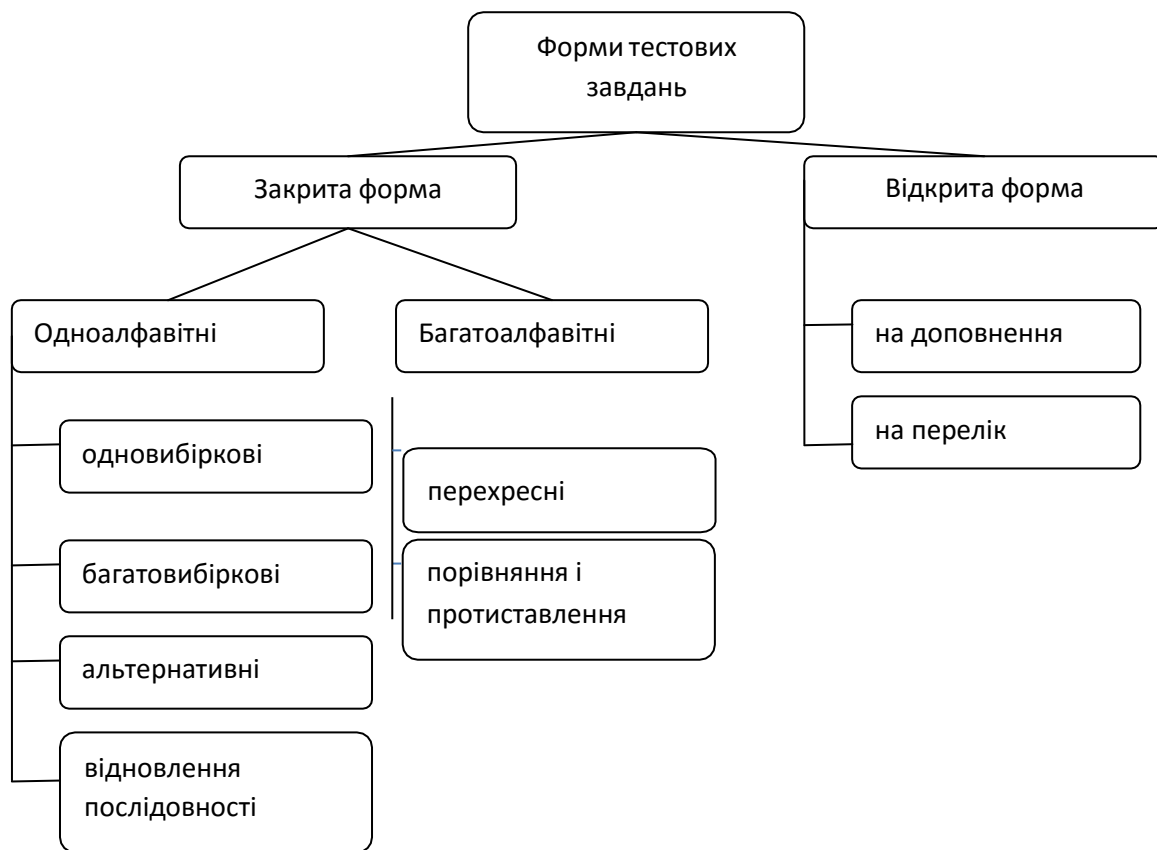
Малюнок 1. Форми тестових завдань за принципами побудови

Тестові завдання закритої форми (завдання з наданими відповідями) складаються з