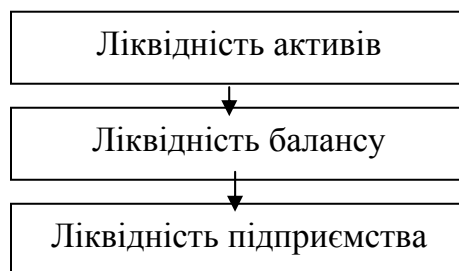
Рис. 2. Зв'язок між категоріями ліквідності

У загальному розумінні ліквідність – це спроможність майна перетворюватися у гроші. В економічній літературі розрізняють такі категорії: ліквідність активів, ліквідність балансу та ліквідність підприємства (рис. 2).