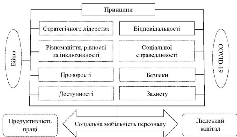
Рис. 1. Взаємозв'язок впливу принципів соціальної мобільності персоналу на продуктивність праці та людський капітал

Варто зауважити, що мобільні працівники зазвичай є агентами змін як і внутрішніх процесів, так і зовнішніх міжорганізаційних відносин. Саме тому дотримання підприємствами принципів, які посилюють соціальну мобільність працівників, є не лише фундаментом здорового робочого середовища, а й також основною вимогою сьогодення. Програми розвитку стратегічного лідерства, формування ефективних взаємин «керівник-підлеглий», застосування принципів різноманіття, рівності та інклюзивності під час наймання працівників та прийняття кадрових рішень, впровадження прозорих підходів до кар'єрних можливостей – першочергові пріоритети у системі управління соціальною мобільністю на підприємстві [2]. За умови негативного впливу деструктивних соціально-економічних процесів відбувається посилення ролі соціального захисту у системі управління мобільністю працівників. Таким чином, втілення програм управління соціальною мобільністю потребує застосування принципів соціальної справедливості, безпеки, доступності, взаємної відповідальності. Слід наголосити на тому, що принцип соціальної справедливості є двостороннім, оскільки його ініціація спрямована на розвиток у працівників підходу, який проявляється через усвідомлення досягнення результатів шляхом ефективної реалізації людського капіталу.