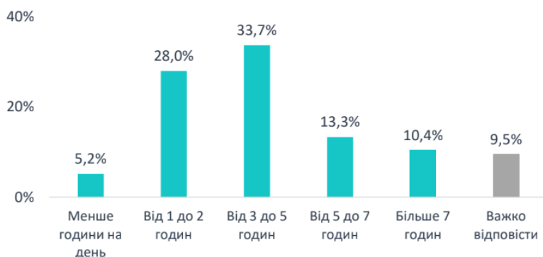
Рис. 2. Час перебування в мережі інтернет щодня

З рисунка 1 аналізуємо, що велика кількість дітей шкільного віку – 89,7% користуються інтернетом майже щодня, лише 8,7% осіб заходять в мережу декілька разів на тиждень, а 1,6% – раз на тиждень.