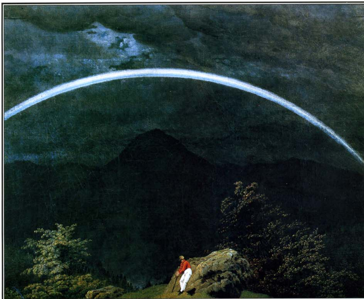
«Горный пейзаж с радугой» Каспара Давида Фридриха.

В фортепианном Концерте соль мажор Бетховен предстает во всем блеске своего новаторского стиля. Произведение было написано в 1804—1807 годах, почти одновременно с Четвертой, Пятой и Шестой симфониями, Фантазией для фортепиано, хора и оркестра и Мессой до мажор. Столь «тесное» соседство показывает, каким плодотворным был для композитора этот период. Чуть раньше он закончил работу над тремя великими сонатами: скрипичной «Крейцеровой» и фортепианными «Вальдштейновской» и «Аппассионатой».