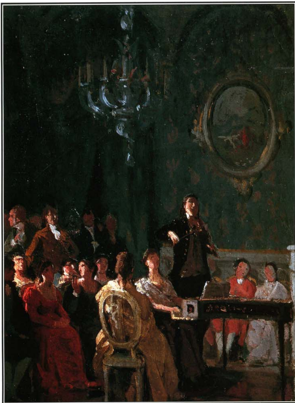
Концерт в салоне XVIII века на картине Аннибале Гатти.

чивых чувств и страстей. Бриджтауэр исполнил сонату в 1803 году. Потом отношения композитора и скрипача испортились: сплетня гласит, что наверняка из-за женщины. Бетховен сменил посвящение, и с 1805 года соната посвящена другому выдающемуся скрипачу современности — французскому Родольфу Крейцеру (1766—1831). Критика сочла произведение «слишком экстравагантным и слишком далеким от принятых норм». Особенно «раздражало» Adagio sostenuto — Presto : и большим объемом, и новаторской трактовкой составных частей, и исключительной сложностью. Но самым непривычным было то, как фортепиано и скрипка соперничают между собой, ведя каждый свою тематическую линию, но в то же время создавая единое и неделимое целое. За исключением редких оазисов лиризма, вся музыкальная ткань — «конкуренция» этих инструментов, так что у слушателя складывается впечатление, будто он свидетель состязания. Вторая часть, Andante с вариациями, представляет собой один из самых интенсивных лирических фрагментов во всей камерной музыке Бетховена. В задумчивости чарующей темы (разрабатываемой в четырех вариациях) таится настоящий пожар. И он разгорится: так сильны эмоции в этой части сонаты. Действительно, взрыв бушующей страсти происходит в пламенном финале ( Presto ). В быстром темпе безумной танталеллы фортепиано и скрипка схлестываются в последний раз. Заключительные аккорды представляют собой мелодическую бурю. Наступающая после нее тишина кажется тишиной после сражения, когда на поле битвы остаются лишь погибшие.