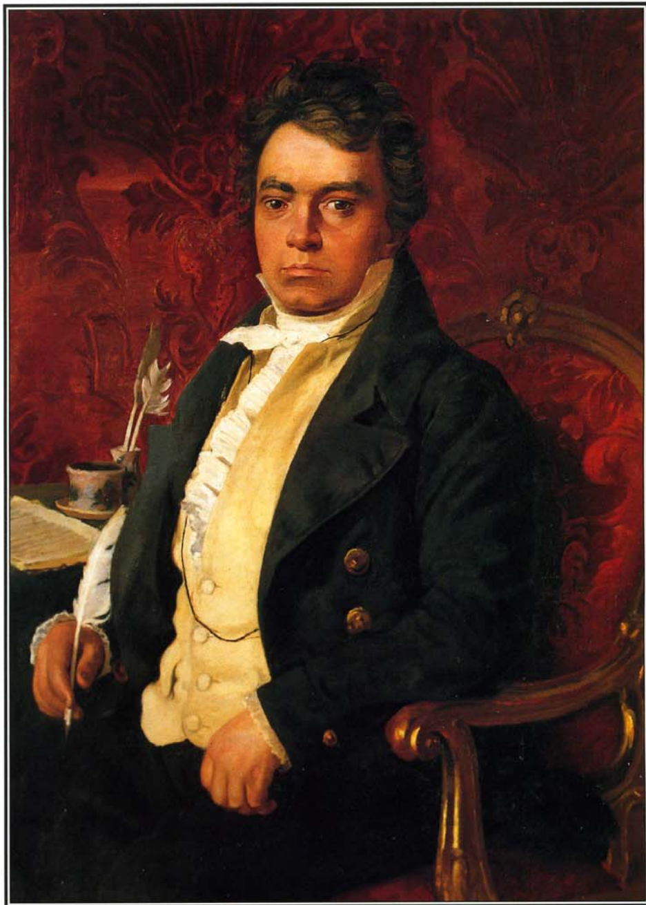
Портрет Бетховена, написанный во второй половине XIX века.

В одном Вегелер был прав: иные из целей Бетховена и впрямь нельзя назвать легкодостижимыми. В поисках верной подруги его порой заносило в такие сферы, куда «простому смертному мешанину», каковым являлся композитор, вход был заказан. Разумеется, увлекался он и дамами своего сословия, однако первой настоящей любовью композитора стала именно аристократка — графиня