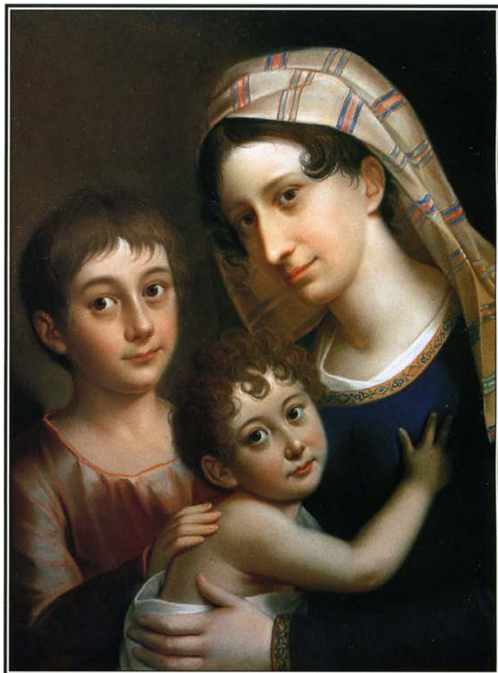
Антони Brentano с детьми.

Терезе? Может быть, Джульетте Гвичарди? В последнее время «бессмертной возлюбленной» композитора принято считать некую Антони фон Биркеншток. Эта дама была десятью годами моложе Бетховена. В 1808 году под давлением отца она вышла замуж за богатого купца Франца Brentano и вместе с ним переехала во Франкфурт. Но в 1809 году она на некоторое время вернулась с семьей в Вену, где спустя несколько месяцев и познакомилась с Бетховеном. Вскоре между ними зародилась сердечная дружба, переросшая в любовь — наконец-то взаимную, но, увы, не имевшую будущего. Бетховен, друживший с мужем Антони, не решился разрушить их брак. Осенью 1812 года семья Brentano вернулась во Франкфурт. С тех пор в биографии композитора не находится и следа какой бы то ни было любовной связи.