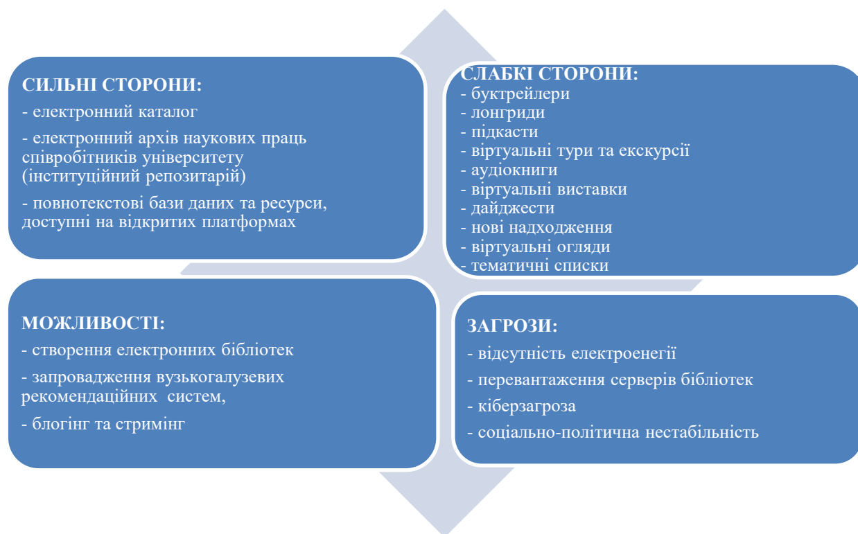
Рис. 2. SWOT-аналіз електронних інформаційних ресурсів бібліотек закладів вищої освіти України

Сильні сторони. Наведена табл. 2 засвідчує, що поширеними електронними інформаційними ресурсами залишаються електронний каталог та електронний архів наукових праць співробітників університету (інституційний репозитарій). Ці електронні інформаційні ресурси стали основними для бібліотек, вони були популярними ще задовго до часів карантинних обмежень.